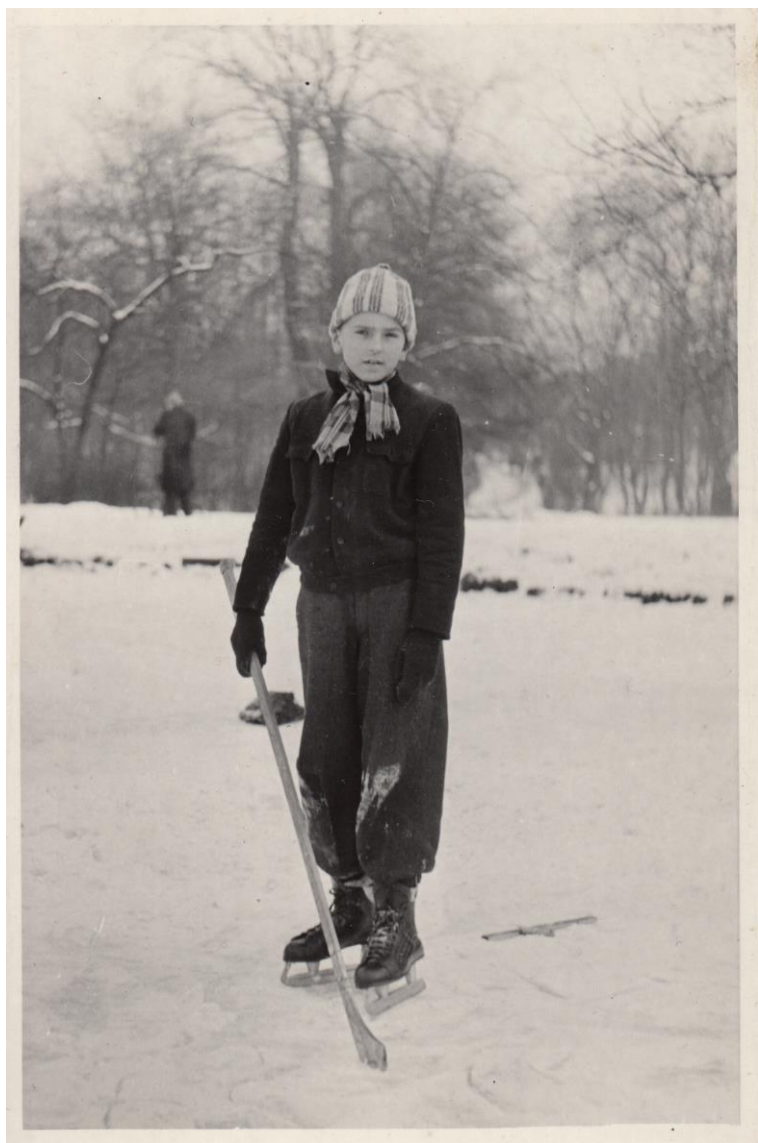
Bruslení ve Stromovce