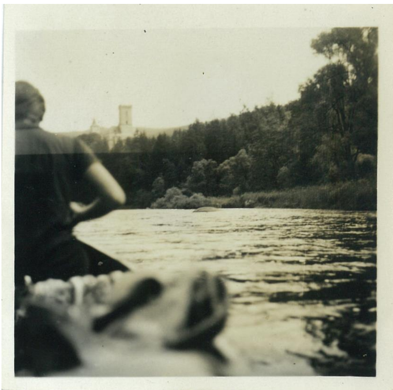
Olina na háčku kanoe. V pozadí hrad Rožmberk