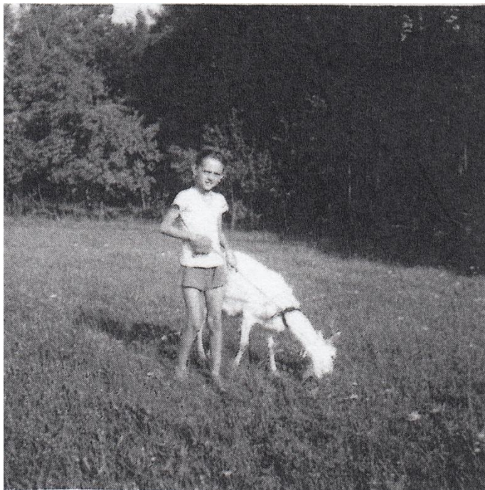
Jenda pase kozy na Sloupu