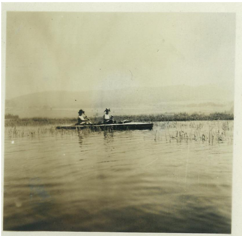
Vjezd do „Jihočeského moře“, skládací kajak