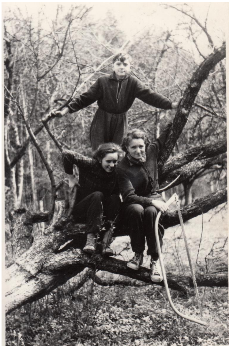
Sourozenci v koruně poražené jabloně