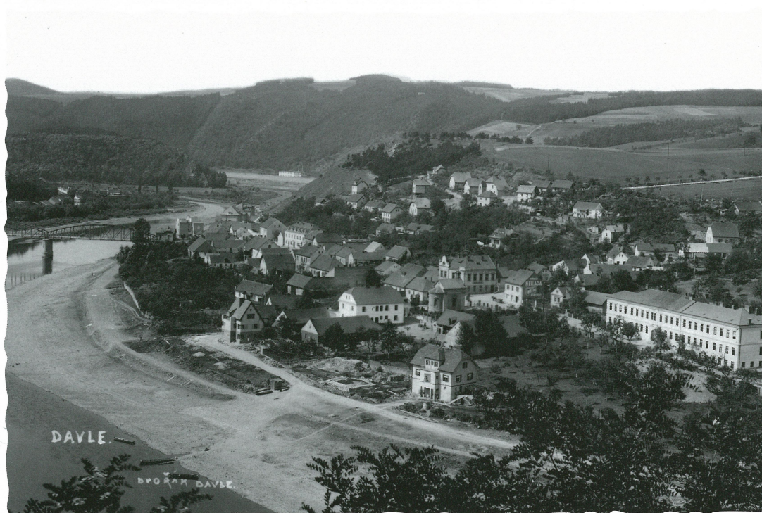
Titulní strana: Davle ve 20. letech