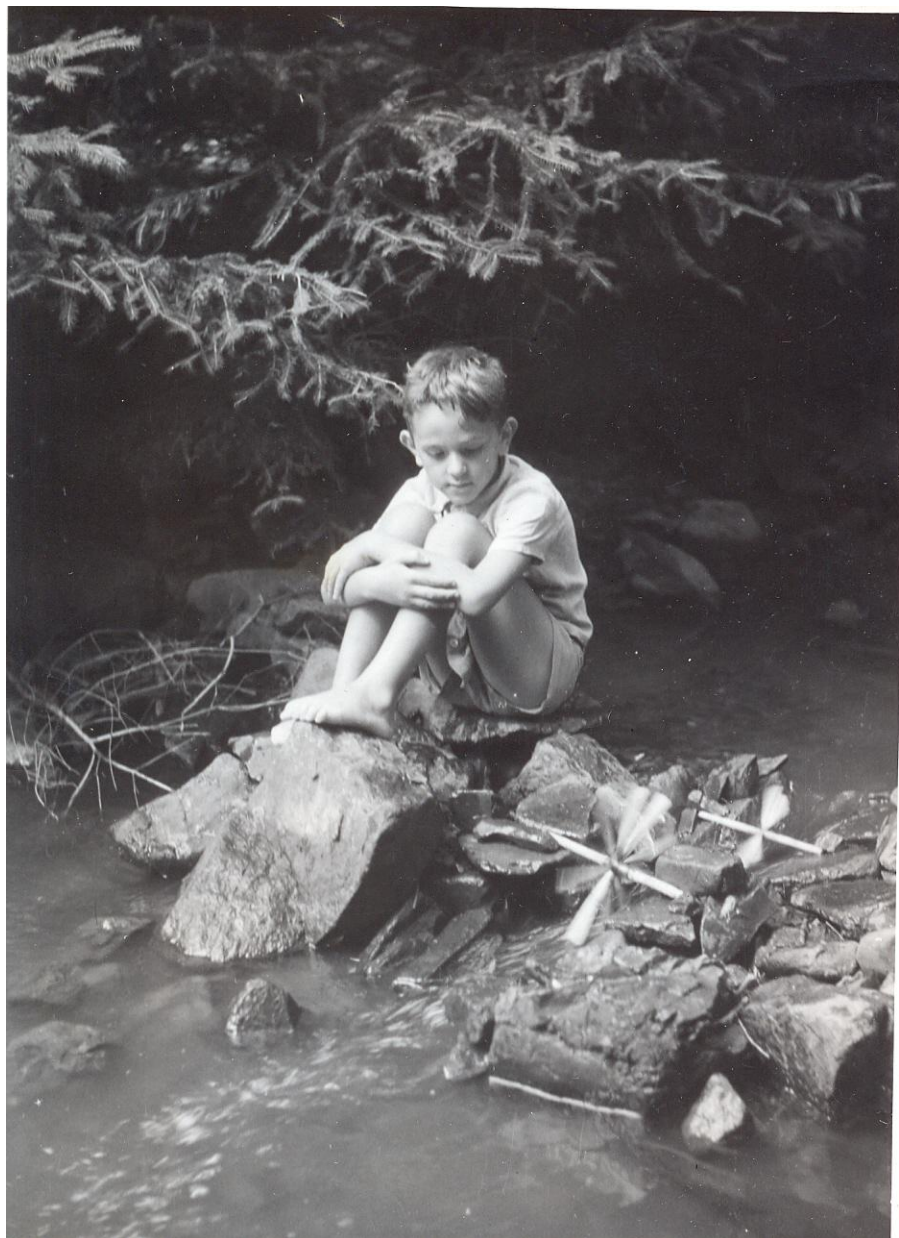
Letní pohoda na Bojovském potoce, kolem roku 1955