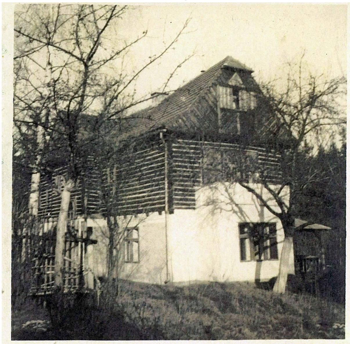
Vila č.p.30 „U Matysů“ ve třicátých letech