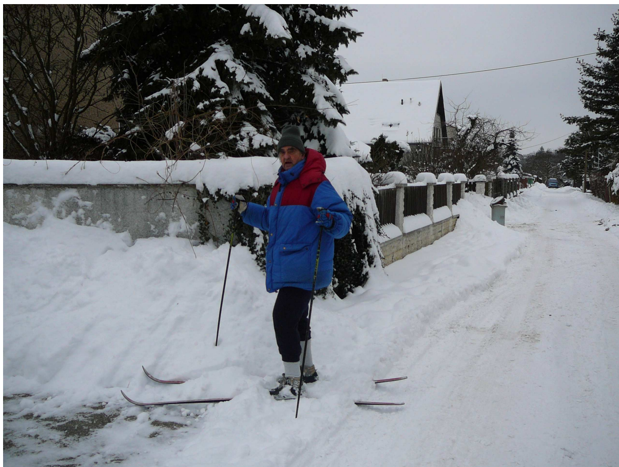
Neobvyklá nadílka sněhu. Měchenice, leden 2010