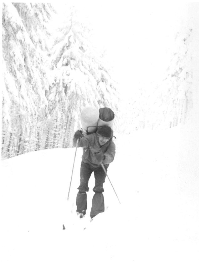
Obr.4. Cesta na Červenohorské sedlo