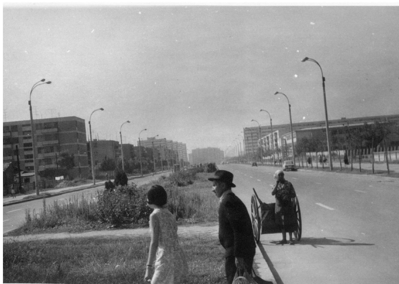
Obr.8. Bukurešť 1970

Když jsem se probudil, byl jsem malátný a měl jsem horečku. Podařilo se nám stopnout nákladní auto s vysokou korbou, které nás dovezlo k přivozu přes Dunaj. Čekání na převoz trvalo asi hodinu. Na druhém břehu jsem se schoval do stínu a Jarda sháněl stopa. Nakonec nás vzal řidič osobního auta, který nás dovezl až k do Konstance před dům sestřiných přátel. Ti se nás hned ujali – na mě ale přišel silný průjem a musel jsem pořád sedět na jejich (tureckém) záchodě, kombinovaném se sprchou. Ve stavení bydleli ještě jiní Češi a ti mě dovezli autem do nemocnice.