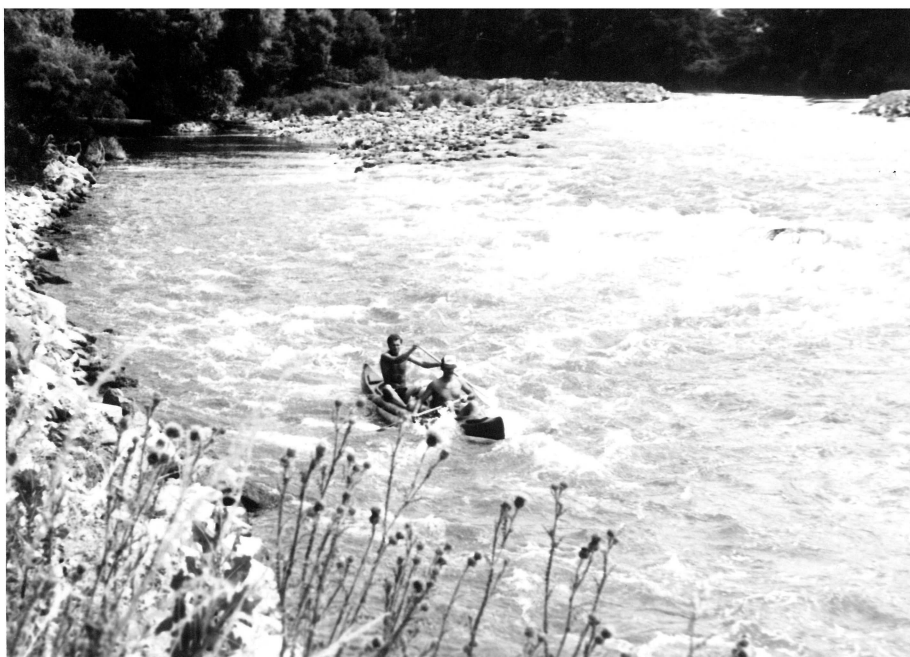
Obr.2. Na Hronu, 1985

Avšak naší nejzajímavější akcí asi byl sjezd Hronu (cca 1981), 20 let poté, co jsem ho sjížděl s rodiči. Svätý Beňadík se mezitím přejmenoval na Hronský Beňadík . Jinak se toho mnoho nezměnilo. I tentokrát si kolem řeky hrály rómské děti. Někteří kolegové uměli maďarsky, a tak jsme chodili na besedu do maďarských vesnic. Jeli jsme podle 20 let starého průvodce až k ústí do Dunaje u Štúrova, kde na nás čekalo překvapení. Nádraží už nefungovalo a autobus sem nemohl přijet kvůli jednomu podjezdu. Museli jsme znovu nasednout do lodí a pádlovat proti proudu.