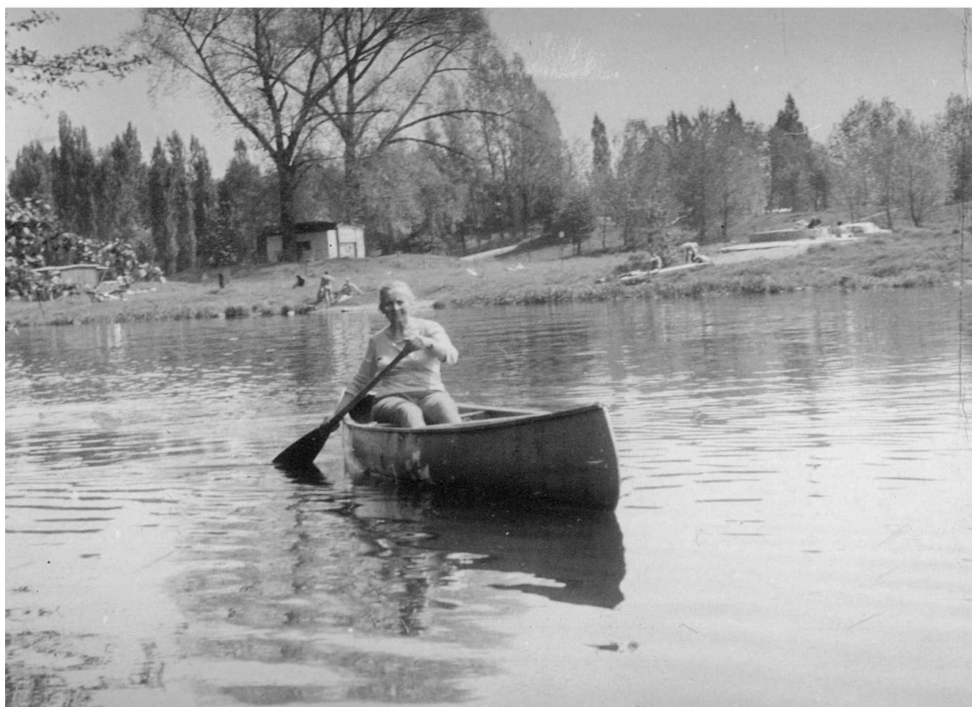
Obr.1. V Bráníku, jaro 1975

Jezdili jsme jako rodina každé léto na cca 14denní „vodní cestu“, nejčastěji jsme sjížděli Lužnici ze Suchdola 6 a horní Vltavu z Lenory. Zpravidla jsme dojeli (přes nově napuštěná přehradní jezera) až do Davle nebo do Prahy. V Davli jsme mívali lodě uschované u známých na zahradě a jezdili se koupat a tábořit na Kyliánský ostrov. Tam se tehdy celé léto tábořilo, byly tam posady pod stan a jezdil tam přívoz. Dnes je ostrov opuštěný a zarostlý; jen jednou ročně (v červnu) se tu na ruinách někdejšího kláštera slouží mše svatá 7 .