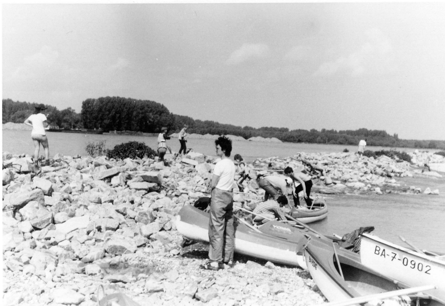
Obr.3. Dunajská ramena před zatopením, 1987

Když jsem pracoval ve Slušovicích (1988 – 89), zúčastnil jsem se výpravy na Otavu. Jeli jsme tam auty a sjížděly se zajímavé úseky. Nebylo to nic moc – nedá se to srovnat s opravdovou vodáckou expedicí, kde člověk žije po nějaký čas v úzkém sepětí s přírodou a musí spoléhat jen sám na své síly! Tady člověk najednou v sobě objeví schopnosti, o kterých neměl ani tušení. Třeba termoregulace – po nějaké době člověku nevadí horko ani chlad. Byla to moje poslední vodácká akce.