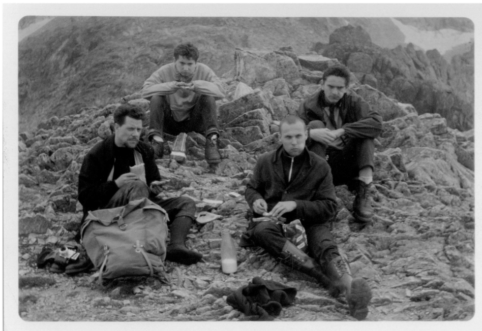
Obr.6. Vysoké Tatry, červen 1968

vedli také diskuse o politice. Byli vesměs loajální ke své vlasti –NDR, ale brali to rozumně. Když jsme se v Praze na nádraží loučili, poukazovali na panující nepořádek na nádraží. V té době přestala policie používat represí a na veřejných místech se vynořilo spousta tuláků a hippies 36 . Celková atmosféra ve společnosti byla však tehdy přátelská a uvolněná – na rozdíl od dneška, kdy na ulicích bují kriminalita.