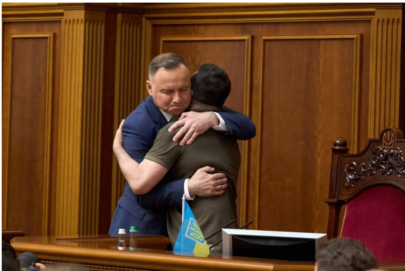
Prezidenti Andrzej Duda a Volodymyr Zelenskyy

A kritizuje bratrovražednou válku mezi Ukrajinci, protože přesně tak tomu bylo, Ukrajinci celých 8 let stříleli na Donbasu na Ukrajince s ruským etnickým původem. To je jediná pravda o Ukrajině, žádná jiná nikdy nebyla a nebude. A podle toho slova ukrajinské hymny zjevně vypadají. Položit duši a život za Ukrajinu, ale co pak? Kdo přijde potom? Kdo bude vlastnit Ukrajinu?