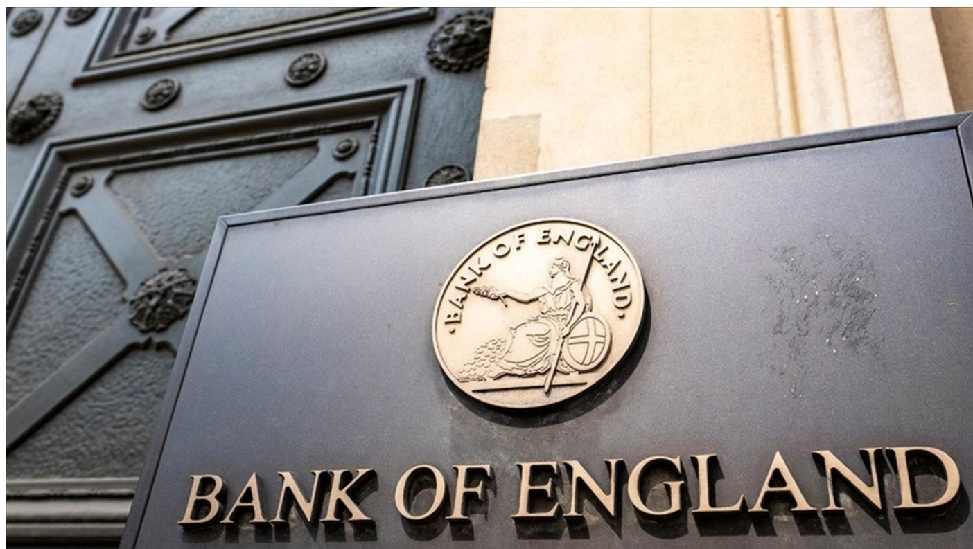
Bank of England

Tento mechanismus dlouho zaručoval, že když si uložíte dolary na swapovém páru s korunou anebo euru na swapu s korunou, tak když přijdete o rok nebo dva později, vyberete po uzavření pozice de facto stejný objem dolarů, za který jste původně kupovali korunu. Byla to dokonalá ochrana EUR a USD uprostřed Evropy, ale na úkor českých mezd, platů a kupní síly českého obyvatelstva. At' se dělo, co se dělo, ČNB nedovolila posílení CZK a tím posílení kupní síly českého dělníka. V londýnském CITY je pražská swapová korunová kasička vysoce oblíbená, ale po vypuknutí ruské operace na Ukrajině a po uvalení sankcí na Rusko, které se tvrdě odrazily zpět a začaly ničit evropské ekonomiky a jejich měny, je najednou všechno jinak.