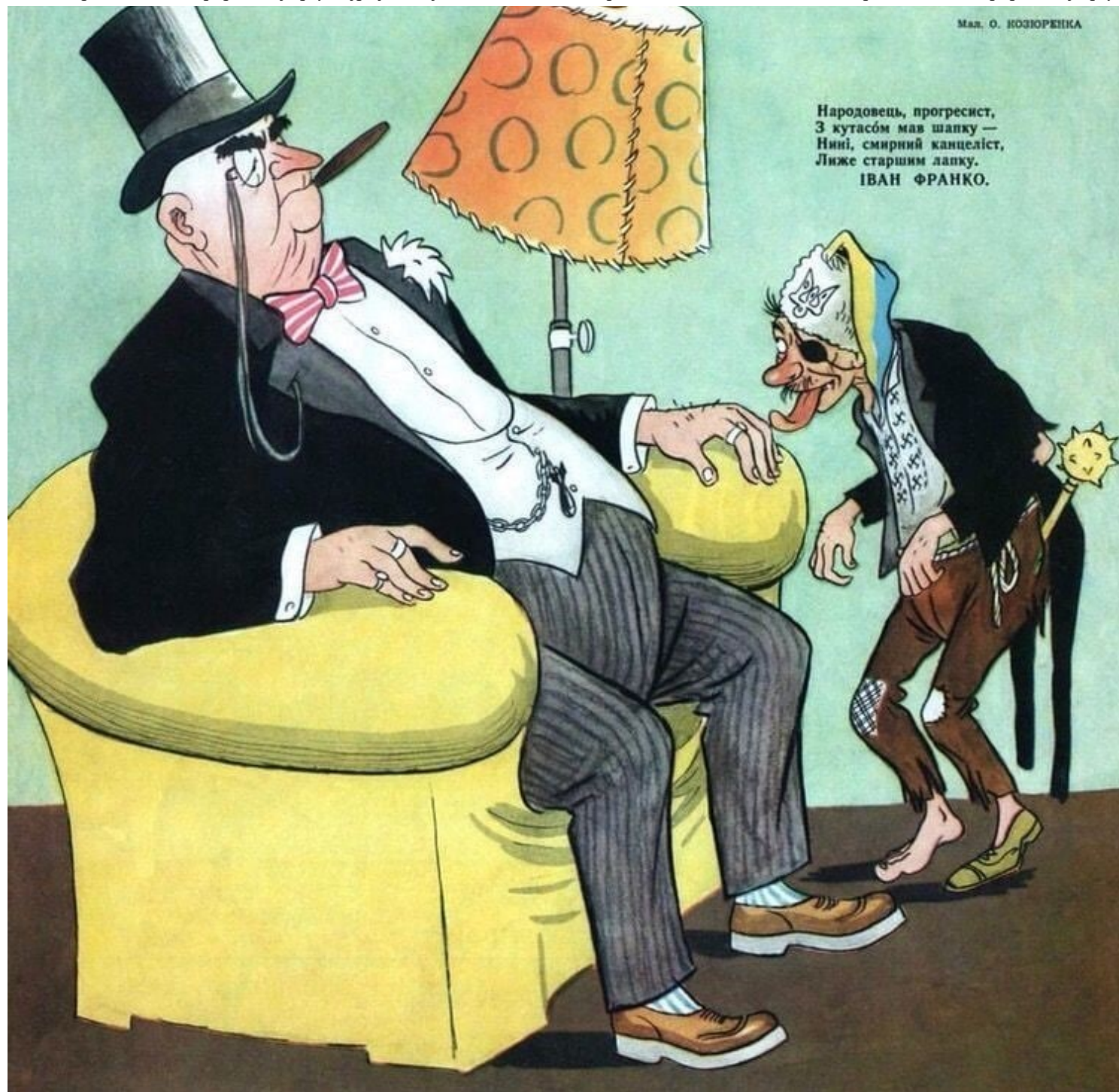
Sovětský satirický časopis z roku 1956 vystihuje i současnou situaci na Ukrajině

Stojí za zmínku, že dva představitelé Spojených států a vysoký úředník administrativy prozradili, že Pentagon dokončuje plány na vyslání systému protiraketové obrany Patriot na Ukrajinu, což by mohlo být oznámeno již tento týden, informovala v úterý americká média. Po zahájení války na Ukrajině a přijetí několika balíčků sankcí proti Moskvě ze strany Západu zrychlil růst cen pohonných hmot, což přimělo vlády mnoha západních zemí uchýlit se k mimořádným opatřením. Západní sankce se však vymstily a měly škodlivý dopad na světové trhy, především na plyn a ropu. Evropské vlády nyní pociťují důsledky svých sankcí v souvislosti s rostoucími stávkami a protesty kvůli životním nákladům a platům.