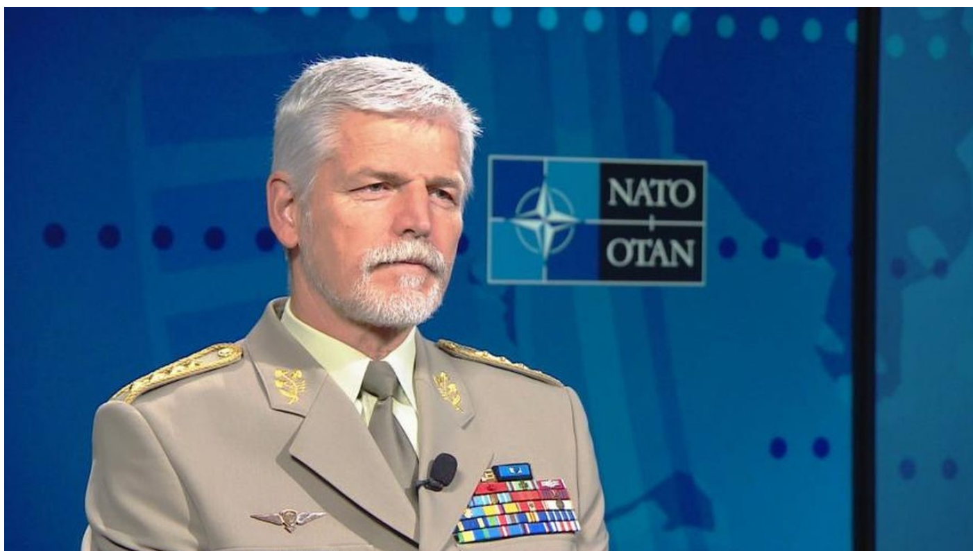
Fialův plánovaný vrchní velitel českých ozbrojených sil Petr Pavel

Uherska. Stáli jsme de facto jen několik hodin minulý týden od zatažení NATO do války s Ruskem na Ukrajině a jenom díky vzpouře polských tankistů k tomu nedošlo.