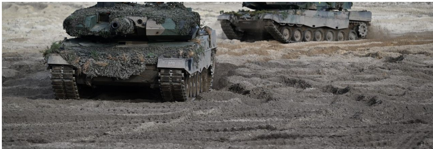
Tanky Leopard s polskými posádkami

Nikdy v historii nemělo Československo natolik šílenou a štváčskou vládu, která žene zemi do války, řinčí zbraněmi a posílá do války na Ukrajině další a další zbraně, přičemž ani to už nestačí a chce změnu Ústavy a právo na posílání i českých vojáků do té války! A kecý o tom, že je to jenom na 60 dnů, si může Jana Černochová jako ministryně obrany strčit do kabelky, protože 60 dnů je dostatečná doba na to, aby tam ti čeští vojáci v těch tancích na frontě zařvali během prvních pár dnů. Je to snaha o vytvoření operačního okna pro vysílání českých vojsk do sebevražedných misí pod nálepkou “zahraniční mise na Ukrajině” a vojáci brzy zjistí, že od misí v Afghánistánu se to bude lišit velmi zásadně. Polští tankisté řekli ne! Otázkou je, jak na vyslání na Ukrajinu budou reagovat vojáci AČR, až na to dojde po schválení zmocňovacího zákona.