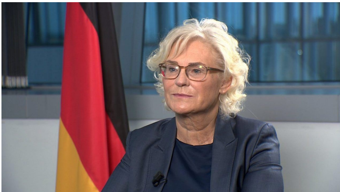
Německá ministryně obrany Christine Lambert rezignovala v pondělí 16. ledna 2023 na svoji funkci

Polsko tak nejen obešlo Německo, ale chtělo obejít i Američany. Nakonec ale celý plán skončil blamáží díky tomu, že se nenašli polští vojáci, kteří by s těmi tanky na Ukrajinu dojeli a chtěli by bojovat za Ukrajinu. Právě naopak. Polský whistleblower odhalil, že celkem 14 polských posádek tanků Leopard rezignovalo na své vojenské pozice a odešli do civilu, odmítli totiž splnit rozkazy a bojovat za Ukrajinu.