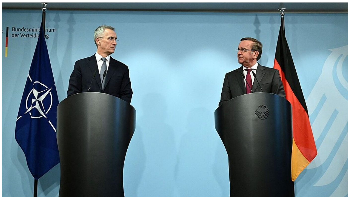
Generální tajemník NATO Jens Stoltenberg a ministr obrany Německa Boris Pistorius

Kreml zvažuje změnu doktríny v reakci na informace agentury Bloomberg [1] o tom, že v Bruselu ministři obran zemí NATO plánují tajnou změnu pravidel pro nasazení vojsk NATO, aby vojska těchto zemí mohla bojovat i v nečlenských zemích NATO a přesto by se mohla nadále spoléhat na kolektivní obranu. Takto zásadní změna doktríny NATO je ohrožením pro Rusko, protože otevře cestu pro vstup vojsk NATO na Ukrajinu pod bezpečnostní garancí aliance.