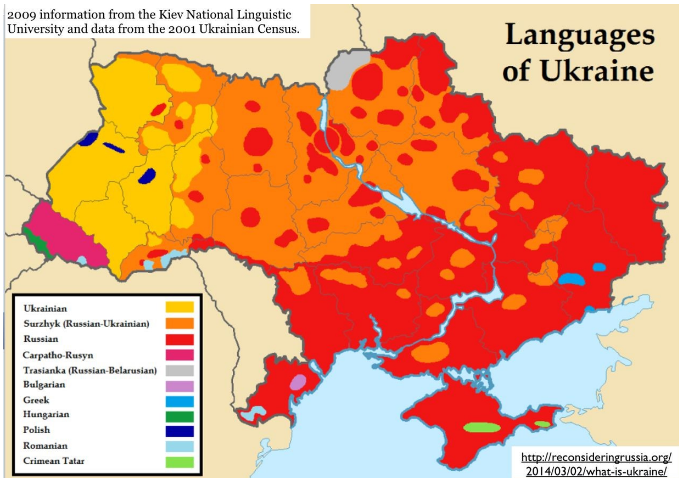
Demografická mapa Ukrajiny z roku 2009

2009 information from the Kiev National Linguistic University and data from the 2001 Ukrainian Census.