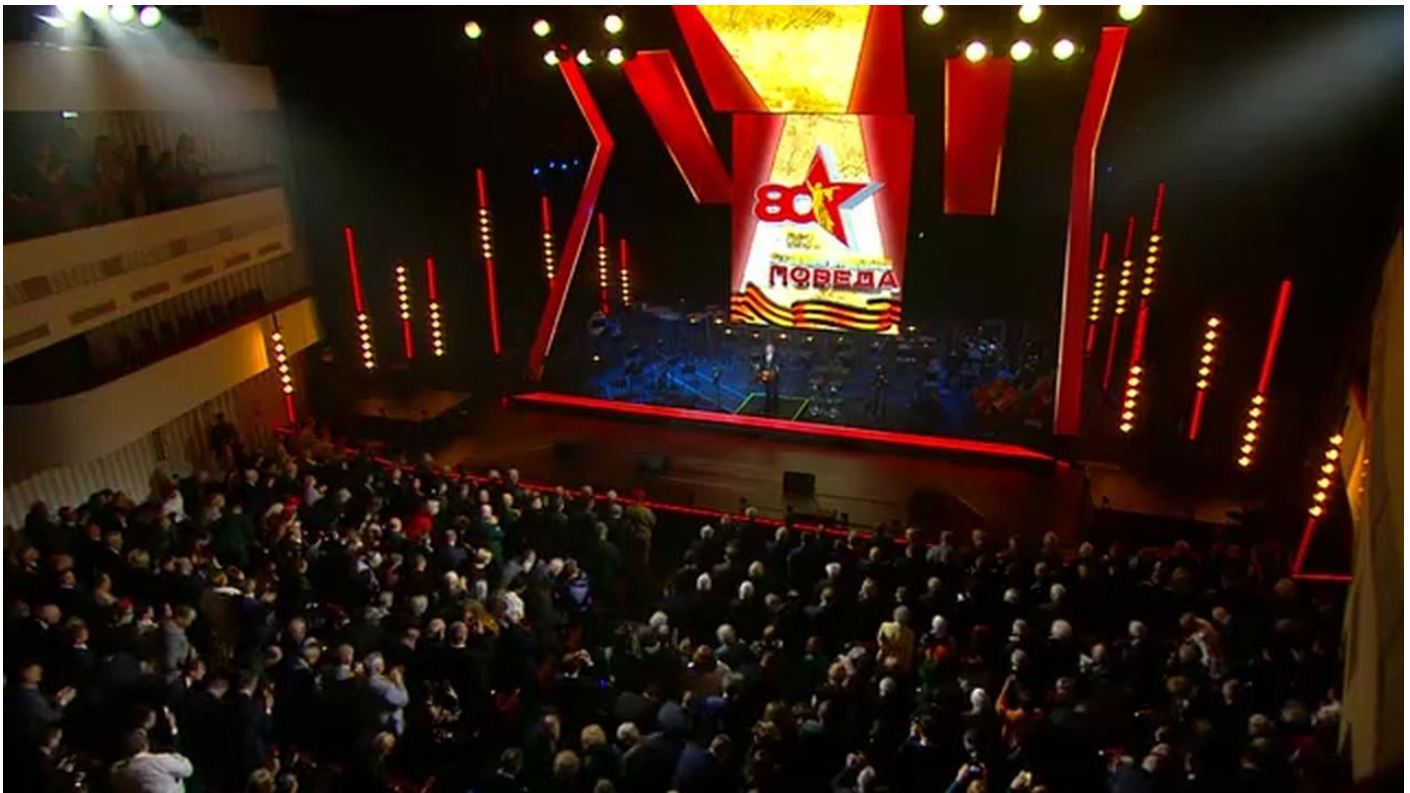
Projev probíhal v divadle ve Volgogradu

na europoslance! Chápete? Oni ženou nás obyčejné lidi do války, ale sami si do zákonů dají, aby jich se to netýkalo. Víte, co to znamená?