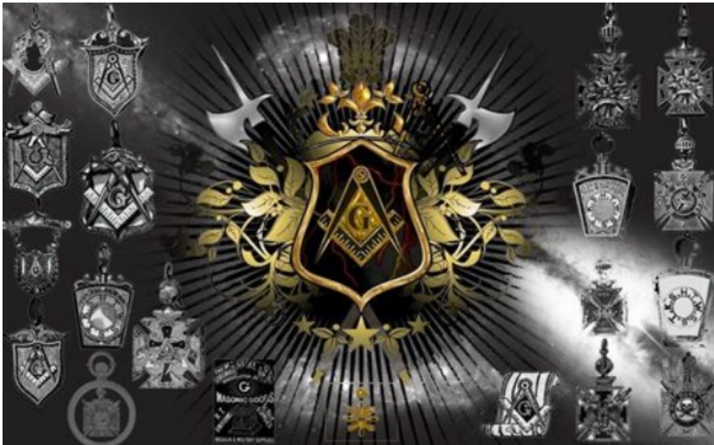
Zednářské štíty lóží s písmenem entity Země - Gaia (Gaiáh -> Goliath -> Obr)

Ten proces jede na plné obrátky a všichni ti, kteří budovali tvrdý a nejbrutálnější kapitalismus, dnes razí co nejrychlejší likvidaci všeho, co vybudovali. Nikomu to nedává smysl, je to doslova útěk za šílenstvím, ale dává to smysl ve chvíli, když zjistíte, že moc Progos je v ohrožení a mohou být zbaveni své vyvolenosti. Písmeno Země "G" v zednářských symbolech by nadobro zmizelo. Tajemství správcovství nad "G" by bylo zničeno. Tomuto procesu wildernizace má pomoci právě i genderová agenda.