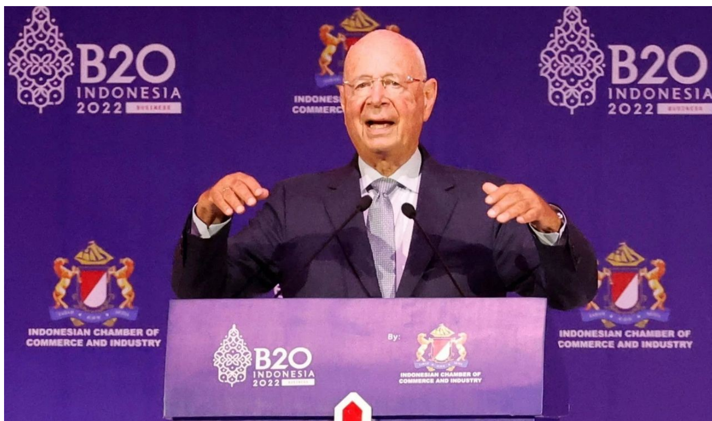
Klaus Schwab na konferenci B20 konané paralelně se summitem G20

Je to útěk zpátky na stromy, ale tak, aby si toho goyim nevšimli, anebo aby proti tomu neprotestovali. Omezení pohybu lidí se teď plánuje i v rámci projektu tzv. 15-minutových měst podle nové teze Klause Schwaba. Je to naprostá novinka z jeho dílny. Lidé ve městech by měli mít dovoleno se pohybovat pěšky anebo na fyzikálním kole (pozn. kolo bez baterií, pouze na šlapání) do okruhu 15 minut od okraje města [2]. Pohyb na delší vzdálenosti by měl podléhat CO2 povolenkám, emisním povolenkám v sociální aplikaci. O této myšlence se zatím moc nemluvilo, ale v Davosu o tom bude určitě řeč. Omezení pohybu lidí je přesně ten proces snížení spotřeby potravin, snížení cestování, upoutání do křesla v bytu.