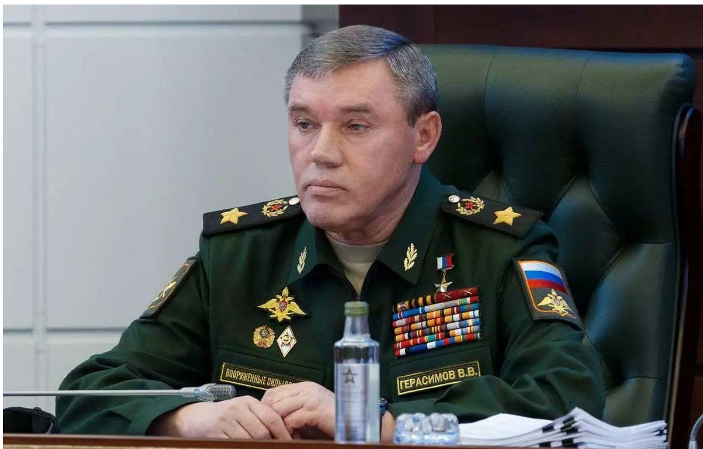
Valerij Gerasimov, náčelník generálního štábu Ruské armády

A protože během bojů jsou vystřeleny stovky nebo spíše tisíce takových střel, dochází potom k zamoření celého bitevního pole. Ještě horší je situace, kdy tato munice v rámci bojů je střílena v městské zástavbě. Dochází potom ke kontaminaci celého města, které potom nemůže být snadno opraveno a znovu vráceno k životu, protože trosky domů a celé ulice jsou zamořené ochuzeným uranem. Použití munice s ochuzeným uranem by tak naplnilo směrnicí Gerasimovovy doktríny o oprávněnosti použití taktických jaderných zbraní proti nepříteli. Tohle je prostě jenom další z řady příkladů eskalace války krok za krokem, stupeň za stupněm.